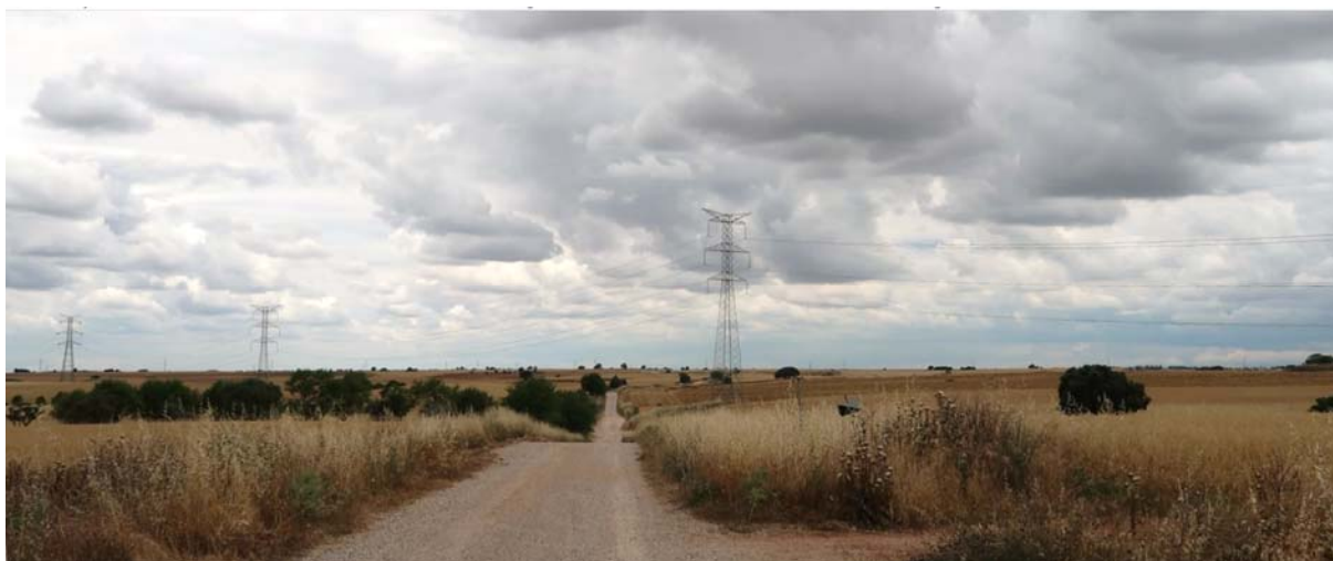
Foto 1. Zona Este, entre Pioz y Santorcaz. Terreno sensiblemente plano o ligeramente ondulado; arbolado de encina disperso entre parcelas de cultivo.