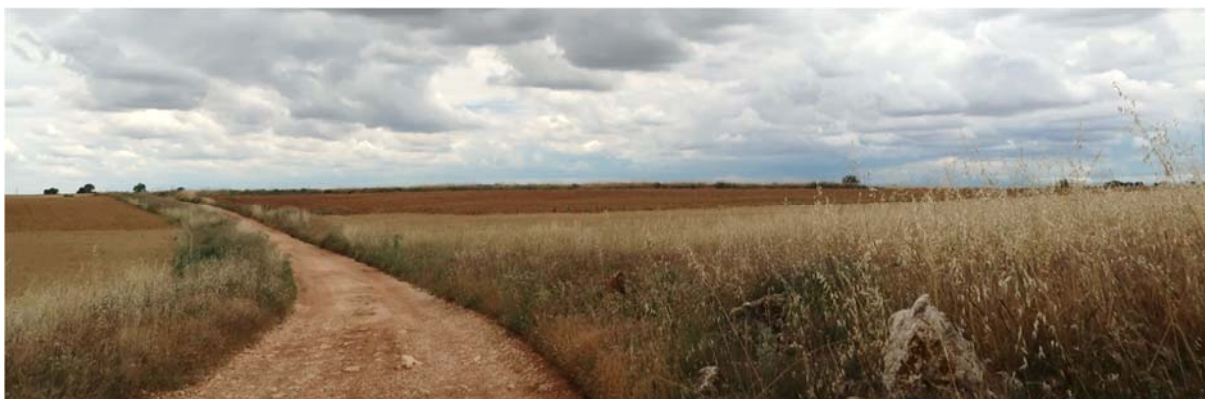
Foto 2. Casi todo el terreno es cereal extensivo excepto una parcela de olivar.